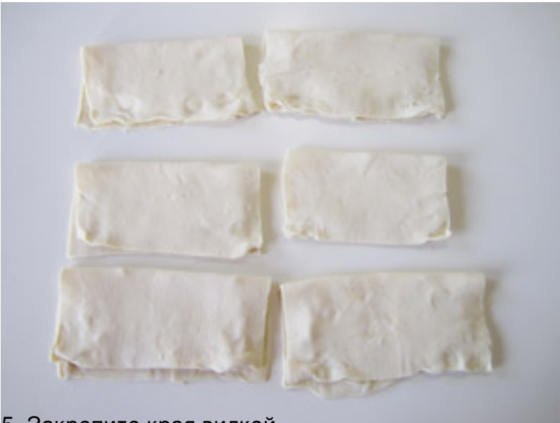
5. Закрепите края вилкой