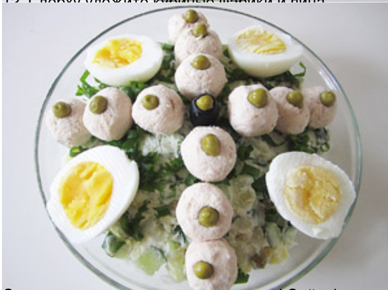
Салат посвященному вашему диплому. С нетерпением жду ваших комментариев, спасибо