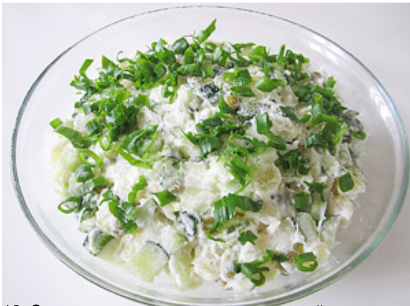
12. Сверху уложите кубики шерики и яйца