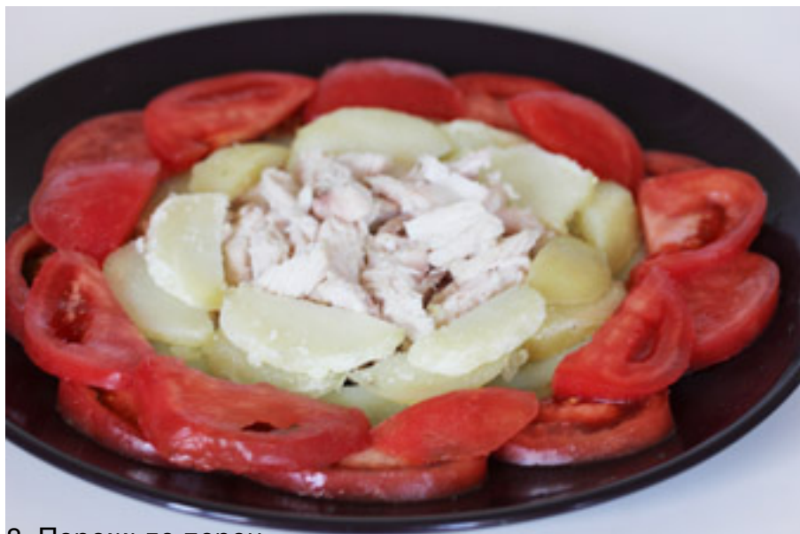
8. Порожьте пороч