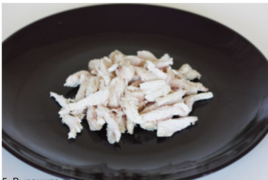
5. Выложите по кругу картофель.