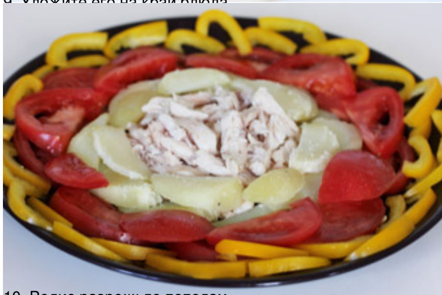
10. Редис разрежьте пополам.